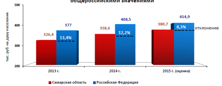
Сравнение среднедушевого ВРП Самарской области с общероссийскими значениями